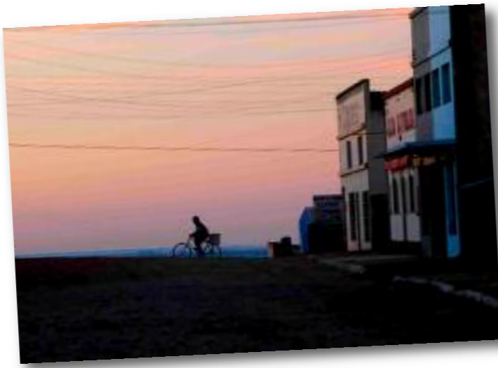
Comédie (Uruguay 2008 - 1h35)

Carte blanche aux Amis de Cinémaginaire Association partenaire de Cinémaginaire depuis plus de 20 ans dans l'animation du Cinéma Jaurès d'Argelès sur Mer