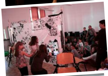
■ Ferrals (11) Ciném'Aude