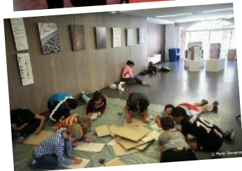
■ Argelès sur Mer (66) Cinémaginaire