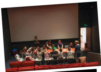
■ Nîmes (30) Cinéma Le Sémaphore