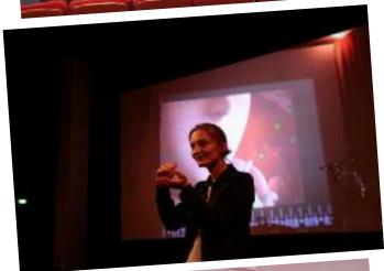
■ Agde (34) Cinéma Le Travelling